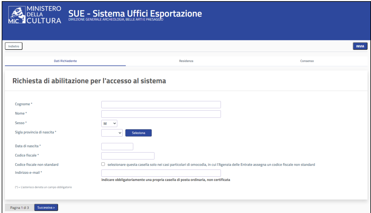
SCHEDA "DATI RICHIEDENTE"